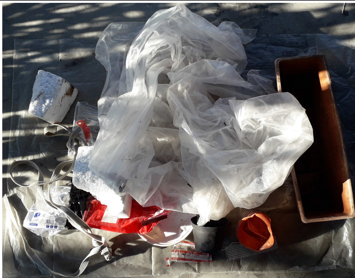
CAMPIONE MEDIO COMPOSITO